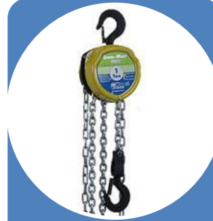
Equipos de elevación y traslación