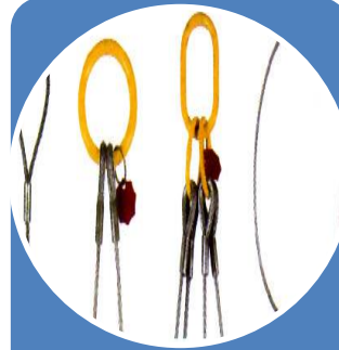
Eslingas (cadena, cable y fibra)