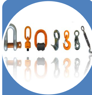
Accesorios de Carga y Sujeción