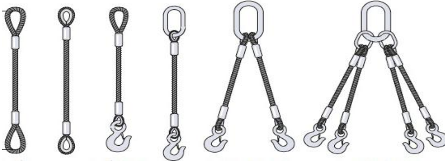
R1 O-O R1 GU-GU R1 O-GA R1 AR-GA R2 AR-GA R4 AR-GA